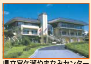
県立宮ヶ瀬やまなみセンター