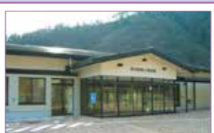
愛川町郷土資料館

開館時間 8時30分～17時(4月～9月) 8時30分～16時30分(10月～3月) 休館日 年末年始 ☎046-281-3646