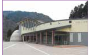
県立あいかわ公園工芸工房村

開館時間 9時～17時 休館日 毎週月曜日(祝日の場合は翌日) 年末年始(12/29～1/3) 利用料金 無料 ☎046-280-1050