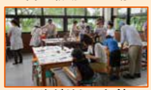
みやがせミーヤ館