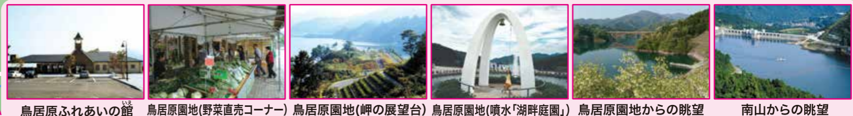
鳥居原ふれあいの館 鳥居原園地(野菜直売コーナー) 鳥居原園地(岬の展望台) 鳥居原園地(噴水「湖畔庭園」) 鳥居原園地からの眺望 南山からの眺望