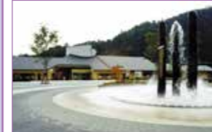
県立あいかわ公園パークセンター

開館時間 9時～17時(4月～11月) 10時～16時(12月～3月) 休館日 毎週月曜日(祝日の場合は翌日) 年末年始(12/29～1/3) 利用料金 無料 ☎046-281-5171