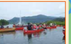
親水池でのカヌー