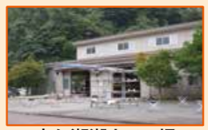
宮ヶ瀬湖カヌー場