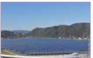
愛川ソーラーパーク 愛川太陽光発電所

開館時間 9時～17時(4～9月) 9時～16時30分(10～3月) 休館日 毎週月曜日(祝日の場合は翌日) 年末年始(12/29～1/3) ただし、繁忙期(GW、夏期等)は休まず開館します。 体験時間 (午前)9時～12時 (午後)13時～16時 利用時間 各体験ごとに異なります。 ☎046-281-2438