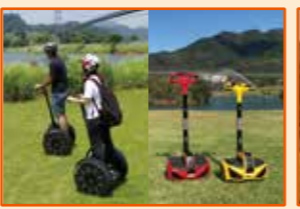
セグウェイ・インモーション