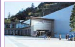
宮ヶ瀬ダム水とエネルギー館

宮ヶ瀬ダム観光放流 毎週水曜日、第2日曜日、第2・第4金曜日 1回目:午前11:00 2回目:午後2:00 ※ただし、12月～翌3月末までは休止です。 ダム管理事務所 ☎046-281-6911