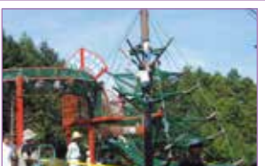
県立あいかわ公園冒険の森

開所時間 9時～17時 10時～16時(12～3月) 休館日 毎週月曜日(祝日の場合は翌日) 見学方法 無料 大型車(マイクロバスを含む)で駐車場を利用する場合、また現場での説明を希望する場合は、事前にご予約が必要です。 連絡先 かながわ水・エネルギーサービス ☎042-768-0222