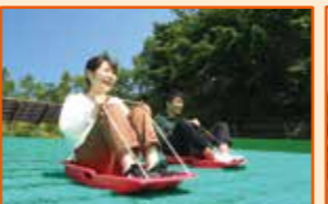
グラススライダー